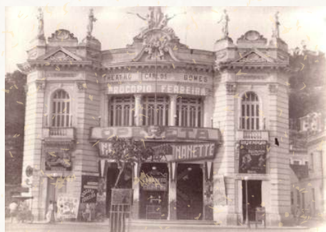
Figura 3 - Teatro Carlos Gomes na década de 1930