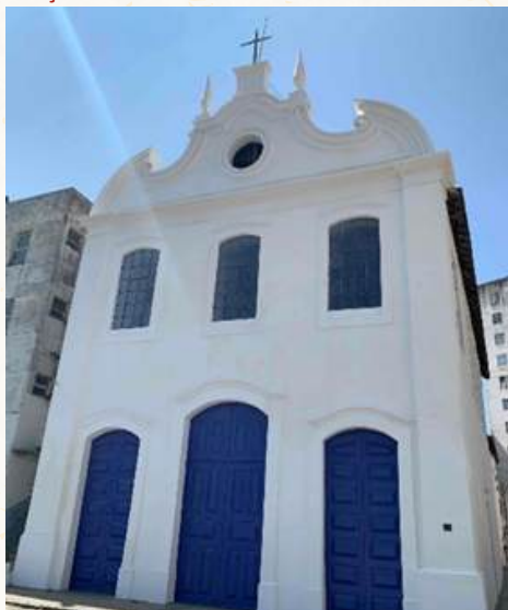
Foto 03 - Fachada Frontal Igreja de São Gonçalo

Localização: Rua Cosme Rolim, 56 - Centro, Vitória – ES