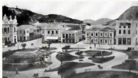
Figura 2 - A praça Costa Pereira (1920)