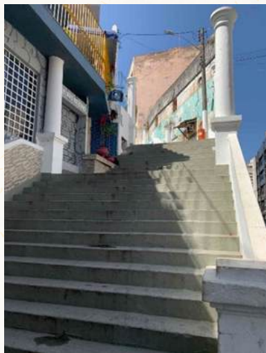
Foto 07 - Escadaria do Rosário

O Hip-Hop e o samba são movimentos culturais e sociais, e formas de resistência e afirmação da identidade negra, e a presença nesse local reforça o vínculo entre o espaço e cultura. Estes eventos além da contribuição para o desenvolvimento social e cultural da área, atraindo visitantes impactando também na percepção pública sobre a importância histórica e cultural da escadaria.